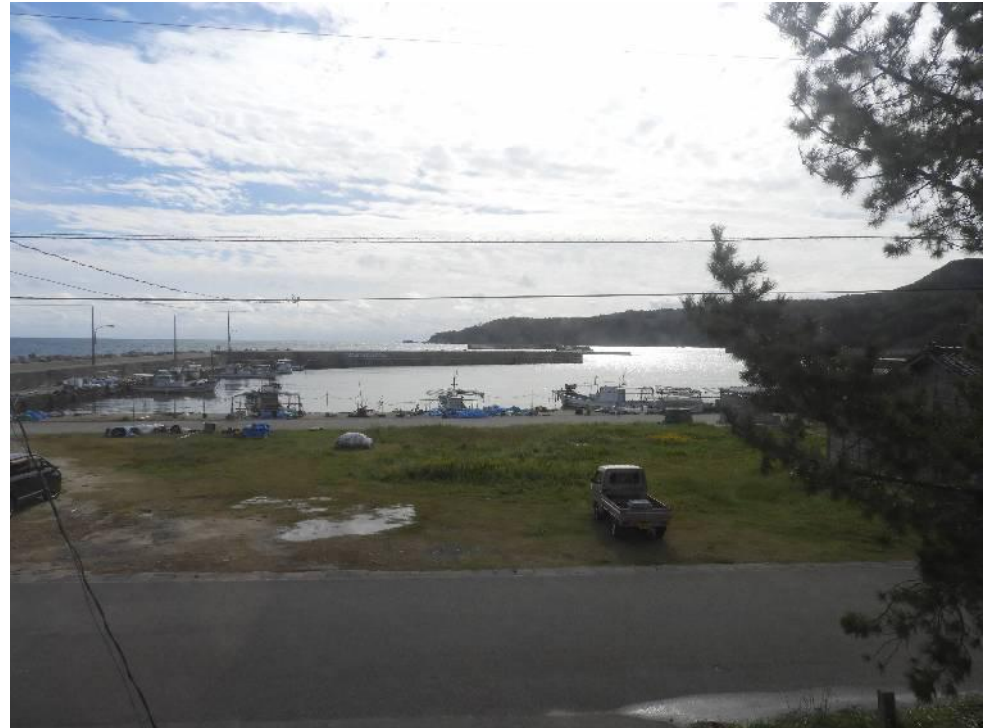
2階からの眺望です。（狼煙漁港）